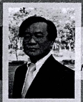
ศาสตราจารย์เกียรติคุณ ดร.อนุรักษ์ นันตนาวัฒน์ บรรยายพิเศษ หัวข้อ การขับเคลื่อนชุมชนให้เข้มแข็งด้วยวิจัยรับใช้สังคม